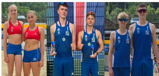
Leikmenn U17 og U19 karla, og U17 kvenna, sem tryggt hafa sér þátttökurétt á lokamótum Evrópumeistaramóta