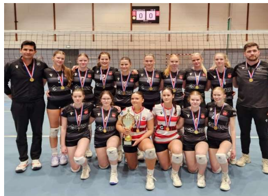
Íslandsmeistarar U20 kvenna 2025

Eitt kvinnalið keppti í 1. deild kvenna, Ýmir, sem endaði í 2. sæti í deildarkeppni og úrslitakeppni 2024-2025. Tvö kvinnalið kepptu í U20 og B-liða deild, sem skipuð voru yngri flokka leikmönnum, þar sem spilaðir voru annars vegar stakir leikir í suðvestur- og norðausturdeildum, og þremur helgarmótum með öllum liðum. HK liðin lentu í 1. og 6. sæti í deildarkeppni og helgarmótin samanlagt og í úrslitakeppninni sigraði HK B og urðu Íslandsmeistarar U20 og B liða. Sama fyrirkomulag var í U20 og B-liða deild karla og var HK einnig með tvö lið þar. Lið HK B endaði í 3. sæti eftir mót vetrarins og sömuleiðis í úrslitakeppni en mjög ungt lið HK Y endaði í 6. sæti. Þetta fyrirkomulag með U20 og B-lið reyndust ekki nægilega vel og það vantaði fleiri sterka leiki svo þessu var breytt að hausti 2025 og er að skila frábærri 1. deildar keppni með mörgum sterkum leikjum.